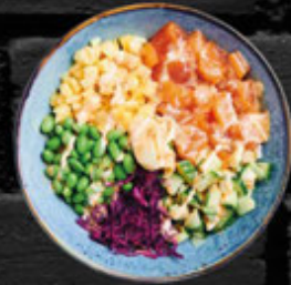
SHAKE BOWL 15,50 €

Reis in Sojasoße, mariniertes Lachs und Thunfisch, Gurke, Rettich, Avocado, Edamame, Masago und Sesamsoße A.B.D.E.F.G.