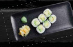
AVOCADO MAKI 4,90 €