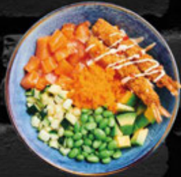
SHRIMP TEMPURA BOWL 15,50 €

Reis in Sojasoße, zwei Crispy Shrimp-Tempura, mariniertes Lachs, Avocado, Edamame, Zucchini, Masago, Sesamsoße und Sweet Chili-Mayo A.B.C.D.E.F.G.