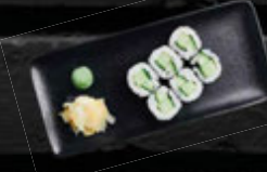
KAPPA MAKI 4,90 €