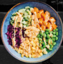
Vegan VEGAN SHAKE BOWL 13,90 €

Reis mit mariniertem veganen Lachs, Mango, Gurke, Edamame, Rotkrautsalat, Chili-Mayo und Sesamsoße A.E.F.G.