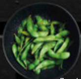
EDAMAME 5,50 €