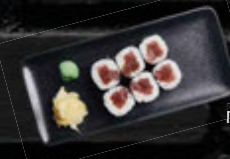
TUNA MAKI 5,90 €