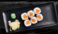
SALMON MAKI 5,90 €