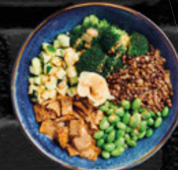
Vegan MIDORI BOWL 13,90 €

Reis mit Tofutasche, Wakame Algensalat in Sesam, Gurke, Avocado, Rettich, Edamame und Unagisoße A.E.F.G.