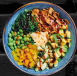
Vegan YASAI BOWL 13,90 €

Reis mit mariniertem veganen Lachs, Mango, Gurke, Edamame, Rotkrautsalat, Chili-Mayo und Sesamsoße A.E.F.G.