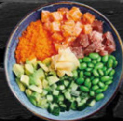
TOMO BOWL 15,50 €

Reis in Sojasoße, zwei Crispy Shrimp-Tempura, mariniertes Lachs, Avocado, Edamame, Zucchini, Masago, Sesamsoße und Sweet Chili-Mayo A.B.C.D.E.F.G.